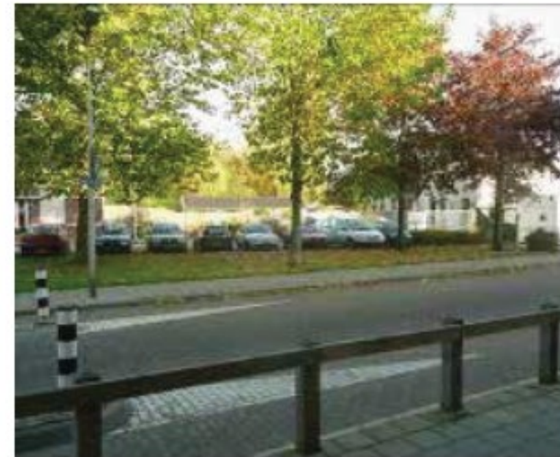
Anjerstraat / Schoolstraat