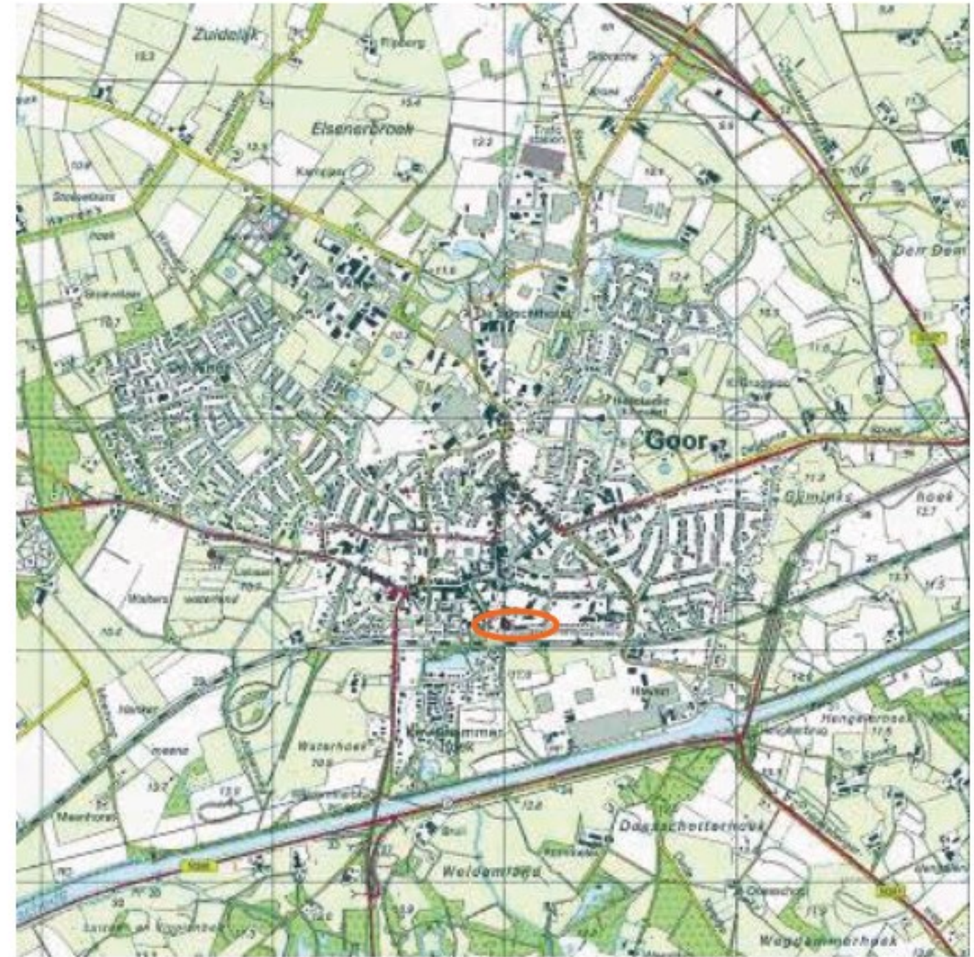
Goor in 2000