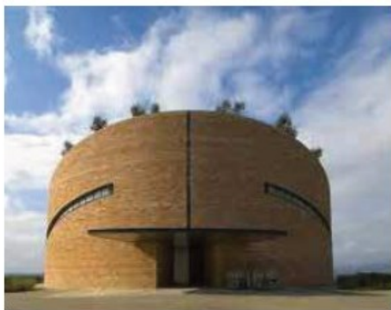
Referentiebeeld kerk Irisstraat