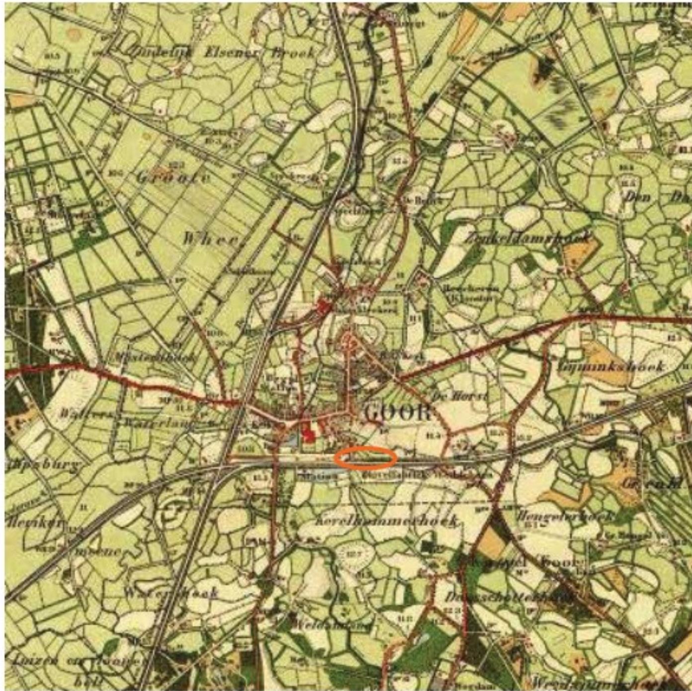
Goor en omgeving rond 1900