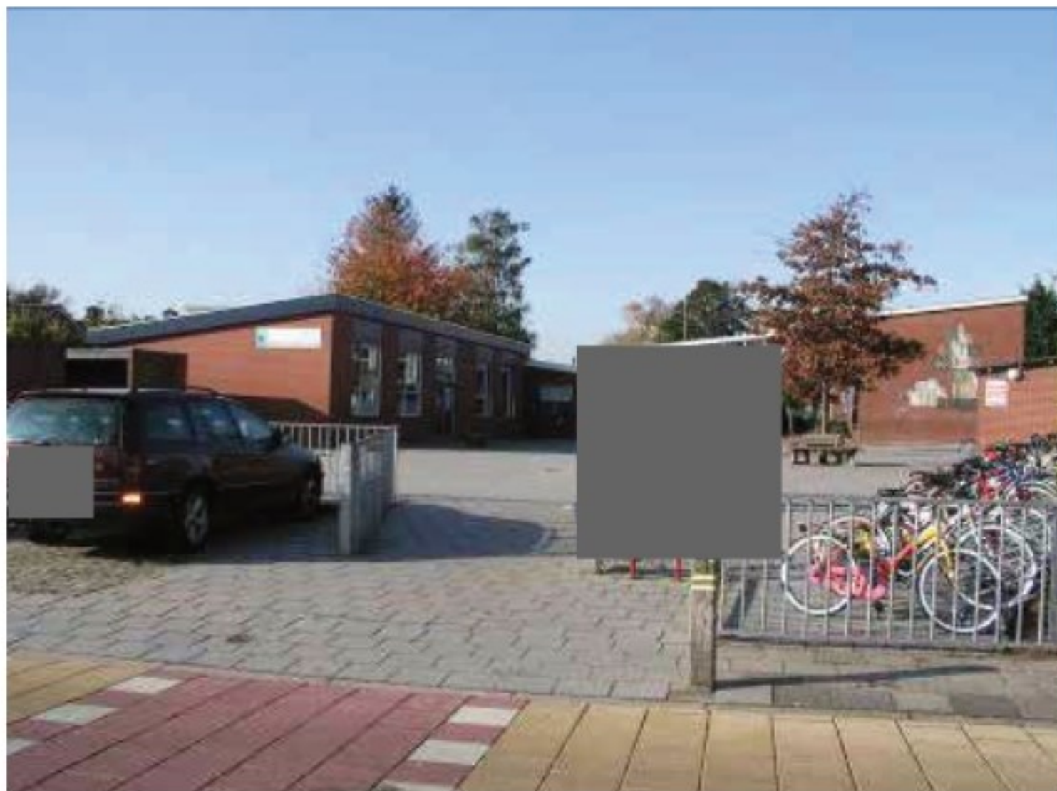
Voormalige Prins Constantijnschool