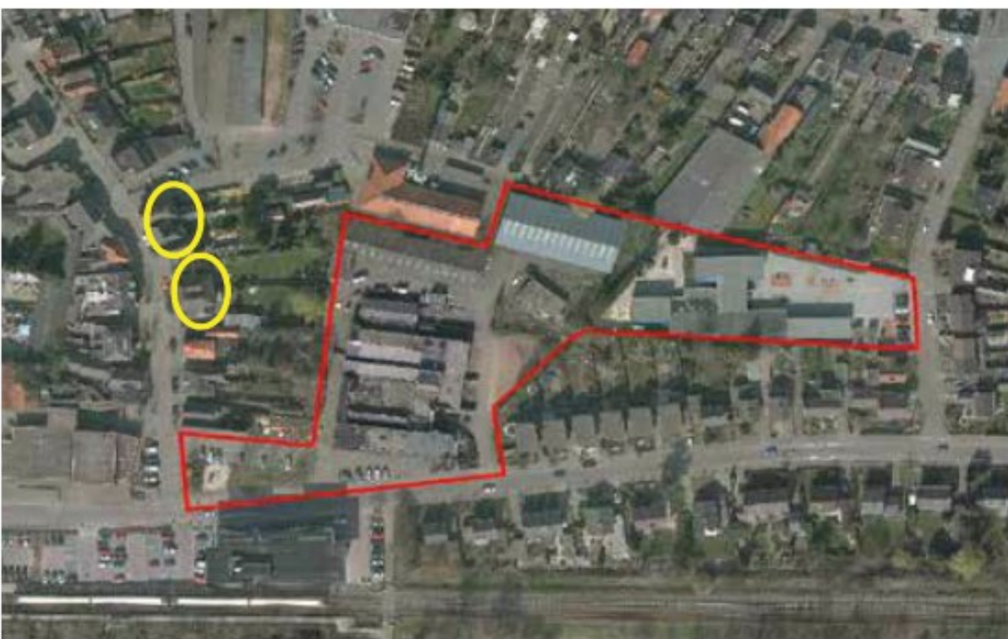
Gemeentelijke monumenten ten westen van 'Constantijnhof'

De inbreidingslocatie ligt deels besloten tussen de bestaande bebouwing langs de Irisstraat, de Spoorstraat, de Schoolstraat en de Anjerstraat. De locatie vormt het overgangsgebied tussen de nieuwere grootschalige bebouwing aan de westzijde, nabij het station, en de kleinschalige woonbebouwing aan de oostzijde van het gebied langs de Irisstraat. De grootschalige bebouwing langs de Irisstraat is opgetrokken uit baksteen in de kleur rood.