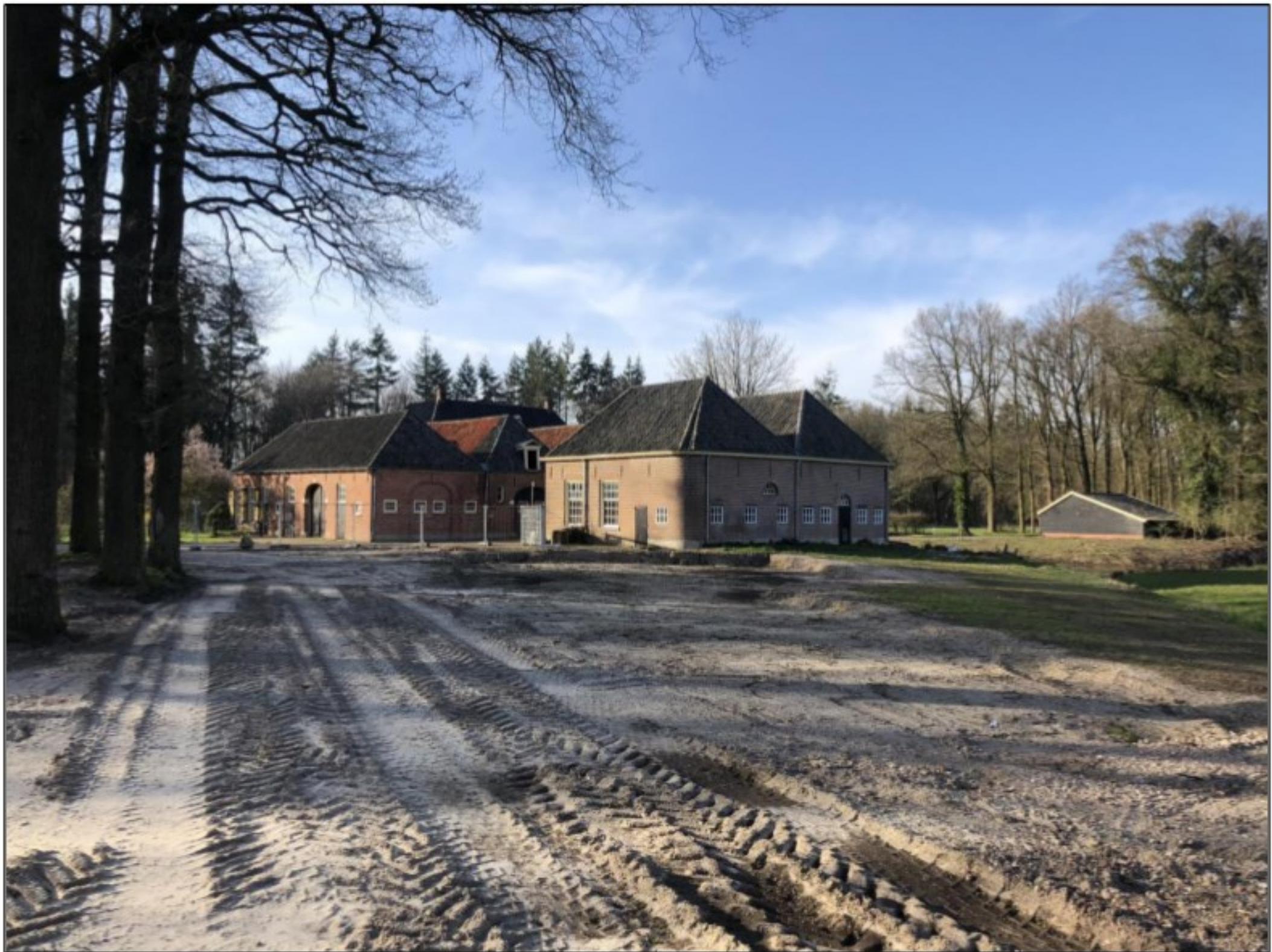
Aanstaande transformatie van het koetshuis (voor) en het bouwhuis (linksachter) tot woonhuizen behorende bij Huis Wegdam in Markelo.