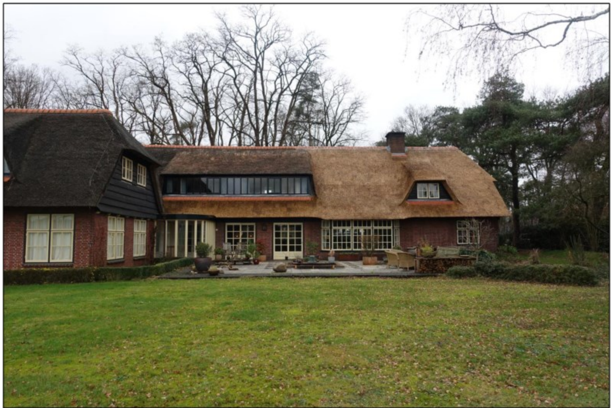
Uitgevoerde rietdekkerswerkzaamheden op het adres Diependaalseweg 8 in Markelo.