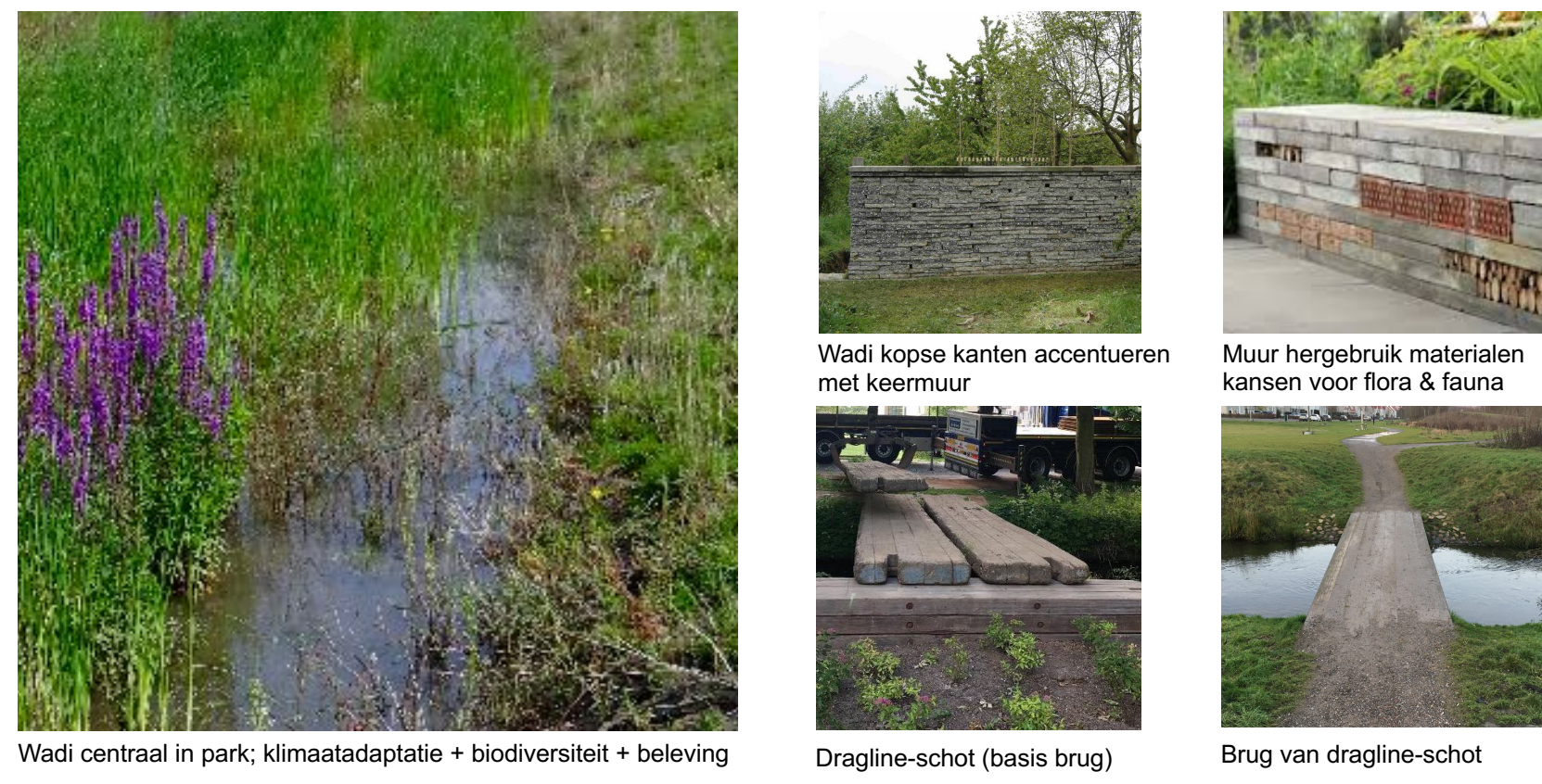
Wadi centraal in park, klimaatadaptatie + biodiversiteit + beleving Wadi kopse kanten accentueren met keermuur Dragline-schot (basis brug) Muur hergebruik materialen kansen voor flora & fauna Brug van dragline-schot