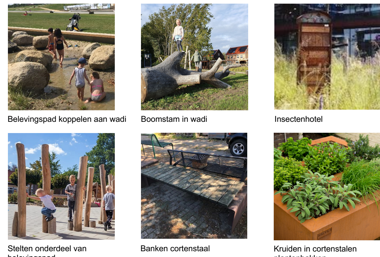
Belevingspad koppelen aan wadi Boomstam in wadi Insectenhof Stelten onderdeel van belevingspad Banken cortenstaal Kruiden in cortenstaal planterbakken