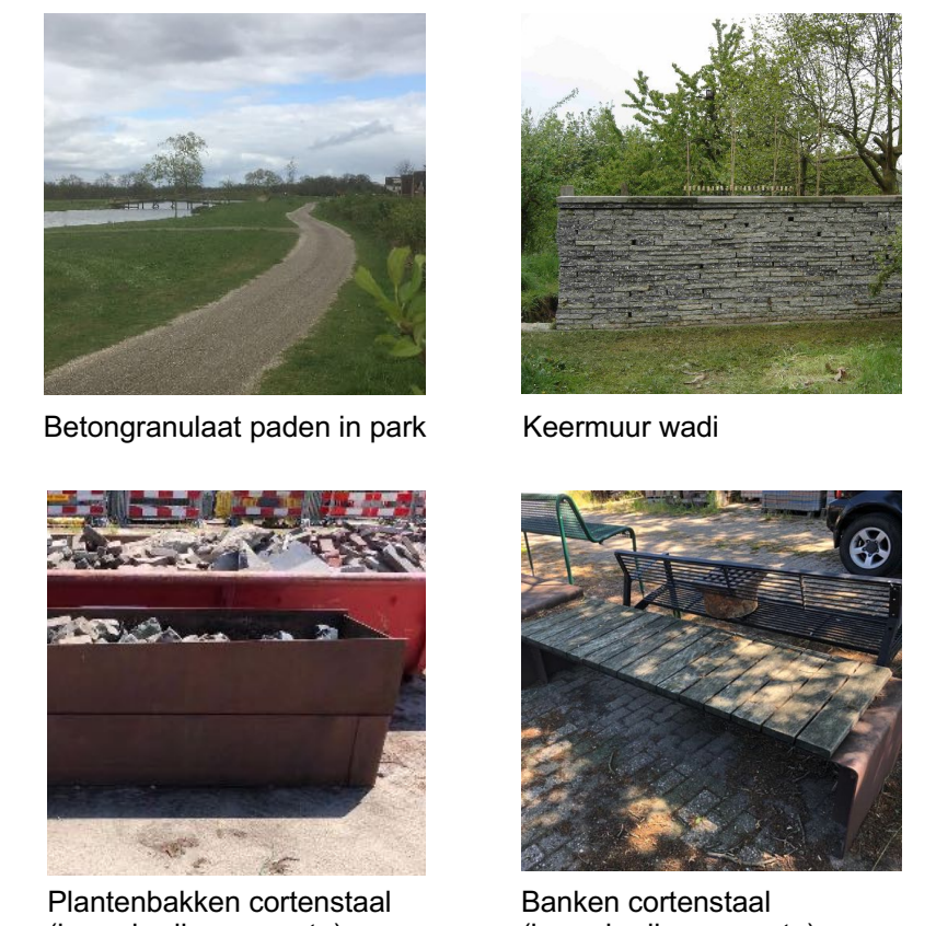
Betongranaat paden in park Keermuur wadi Plantenbakken cortenstaal (hergebruik gemeente) Banken cortenstaal (hergebruik gemeente)