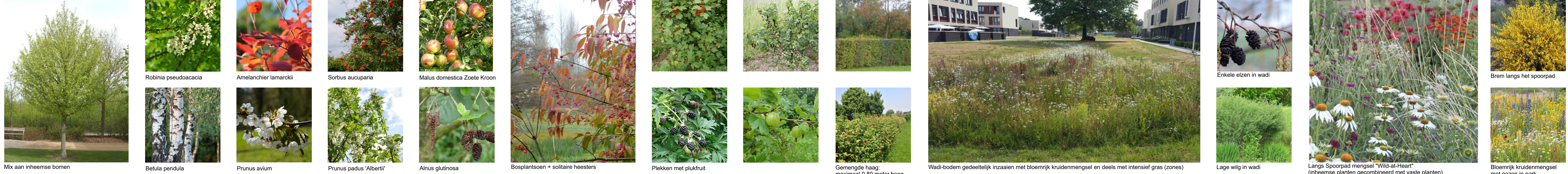
Mix aan inheemse bomen Betula pendula Prunus avium Prunus padus 'Albirtii' Ahus glutinosa Bosplantsoen + solitaire heesters Plekken met plukfruit Gemengde haag maximaal 0.80 meter hoog Wadi-bodem gedeeltelijk inzaaien met bloemrijk kruidenmengsel en deels met intensief gras (zones) Enkele elzen in wadi Lage wilg in wadi Langs Spoorpad mengsel "Wild-at-Heart" (rheemse planten gecombineerd met vaste planten) Bloemrijk kruidenmengsel met gazon in park