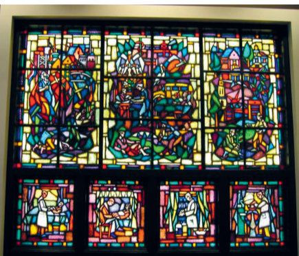
Glas in lood raam 270 cm x 350 cm x 21 cm

Gemeente Hof van Twente heeft onlangs twee waardevolle kunstwerken van Riemko Holtrop in handen gekregen. Het gaat om glas-in-loodramen uit de jaren vijftig, afkomstig van het voormalige Ziekenfondsgebouw op de hoek van de Hengevelderstraat en de Voorstraat in Goor. Op dit moment liggen deze kunstwerken opgeslagen, maar de gemeente wil ze snel weer aan het publiek tonen.